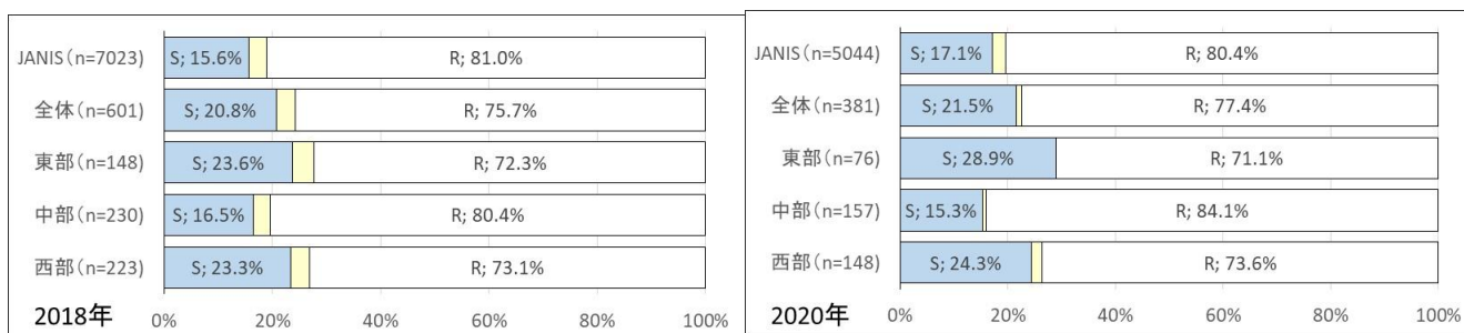
図3 肺炎球菌(髄液検体以外)のEM感受性比較 S:感受性、R:耐性

大腸菌の第3世代セフェムの感受性はどの地域でも改善傾向であり、全国に比べても良い感受性となっています。ただ、東部では他の地域と比較してやや感受性が低めとなっています(図2)。肺炎球菌のマクロライド感受性に関しては、東部で改善傾向であり、西部は横ばいかわずかに改善、中部は横ばいか若干悪化しています(図3)。